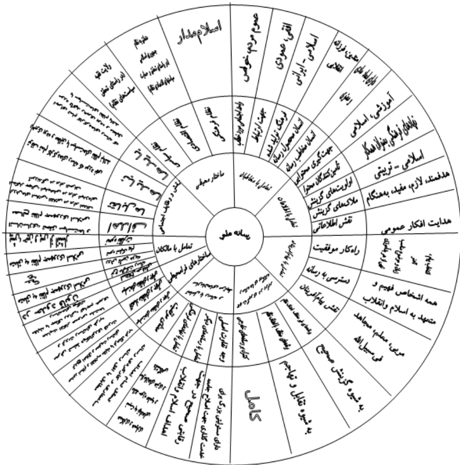
منبع: مرکز تحقیقات صدا و سیما جمهوری اسلامی ایران (باهر، ۱۳۸۹: ۱۲۴)