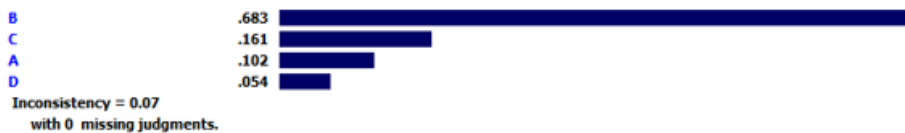
نمودار ۱. وزن نهایی شاخص‌های اصلی

همان‌گونه که در جدول (۱) ملاحظه می‌گردد؛ شاخص "تهدیدات نظامی - امنیتی (B)" با دارا بودن وزن ۰/۶۸۳ بیشترین اهمیت از نظر خبرگان را به خود اختصاص داده است. همچنین شاخص‌های "تهدیدات اقتصادی (C)" با وزن ۰/۱۶۱، "تهدیدات سیاسی (A)" با وزن ۰/۱۰۲ و "تهدیدات فرهنگی (D)" با وزن ۰/۰۵۴ در رتبه‌های دوم تا چهارم قرار گرفته‌اند. نرخ ناسازگاری این ماتریس برابر با ۰/۰۷ به‌دست آمده است، از آنجایی که این مقدار از ۰/۱ کوچک‌تر است، لذا می‌توان نتیجه گرفت که قضاوت‌ها و مقایسات زوجی دارای سازگاری و پایایی است.