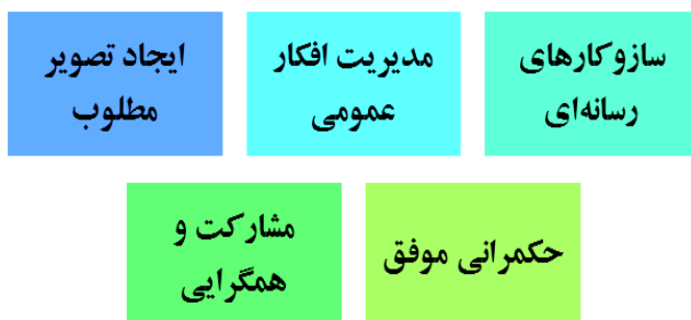
شکل شماره ۱. شاخص‌های کارکردی قدرت هوشمند (صالح‌نژاد، ۱۳۹۸: ۱۰)

در حال حاضر قدرت‌های بزرگ جهان همانند آمریکا با استفاده از قدرت هوشمند و همچنین ابعادی نظیر «توسعه»، «جهانی‌شدن» و «ارمغان دموکراسی برای کلیه کشورهای دنیا» اهداف خود را دنبال می‌کنند و در تلاش هستند در جایگاه برتر قرار گیرند. گرچه با ریاست‌جمهوری «دونالد ترامپ» این روند در آمریکا کمی افول کرد؛ با این وجود، رگه‌هایی از این بهره‌برداری مشاهده می‌شود (تائب، ۱۳۹۹: ۱۲).