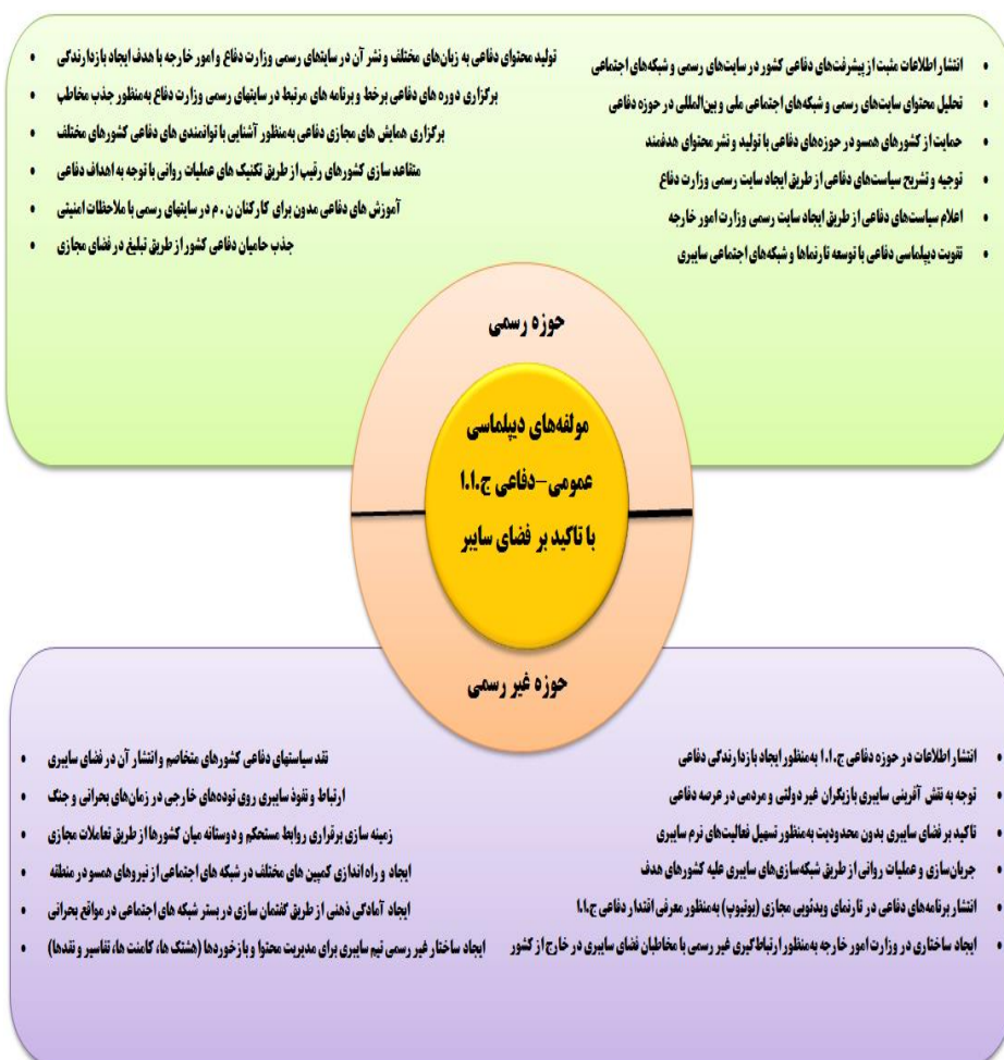
شکل شماره ۱. چارچوب نظری پژوهش

در یک جمع‌بندی کلی از مطالعه متون مرتبط با دیپلماسی به‌ویژه دیپلماسی دفاعی و سایبری، دفاع و بررسی پژوهش‌های صورت گرفته در زمینه موضوع، الگوی اولیه مؤلفه‌های دیپلماسی عمومی-دفاعی جمهوری اسلامی ایران با تأکید بر فضای سایبر، شناسایی و با انجام مصاحبه با خبرگان، ضمن مقایسه و تلفیق عوامل مؤثر به‌دست‌آمده از ادبیات تحقیق و نظرات خبرگان، چارچوب نظری پژوهش به شرح زیر طراحی و ارائه گردید.