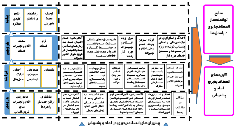
شکل شماره ۲: چارچوب مفهومی انعطاف‌پذیری در آماد و پشتیبانی مبتنی بر موضوع پیش‌ران‌ها