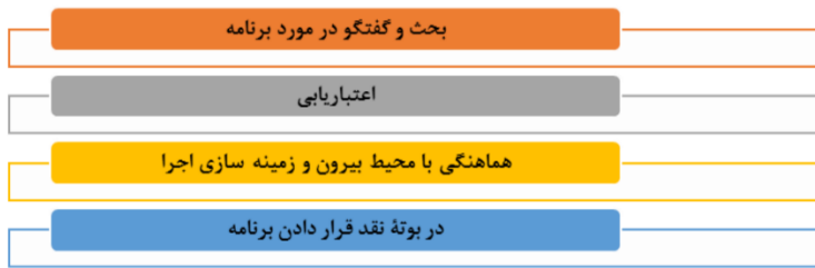
شکل شماره ۳- الگوی برنامه ریزی درسی نایت و همکاران (۲۰۱۴)

نایت و همکاران برای طراحی برنامه ریزی درسی چرخه ای را در نظر گرفته اند. این چرخه کاملاً با توجه به فاکتورهای محلی، متمرکز بر مسائل سازمانی، فنی و تربیتی تدوین شده است. همانطور که از شکل زیر مستفاد میشود از نظر نایت و همکاران تمرکز کار تدوین برنامه بر جلب مشارکت ذینفعان و زمینه سازی برای اجرای آن قرار دارد و آنها کمتر به مسائل فنی پرداخته اند. نایت و همکاران همچنین معتقدند پس از طراحی برنامه طی یک فرایند چهار مرحله‌ای برنامه برای اجرا آماده میشود. این مراحل به شرح زیر است (فتیحی، ۱۳۹۲):