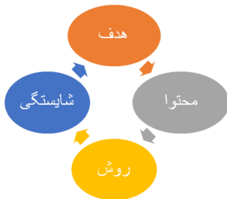
شکل شماره ۶- چارچوب مفهومی تحقیق

حاضر میباشند لذا بر مبنای الگوی فرآیندی برنامه ریزی درسی بردی (۲۰۱۳)، تدوین برنامه ریزی درسی در چهار بعد معرفی شده که با توجه به متناسب بودن و سادگی ابعاد آن با مراحل تحقیق، به عنوان چارچوب نظری تحقیق انتخاب شده و به شرح زیر میباشد: