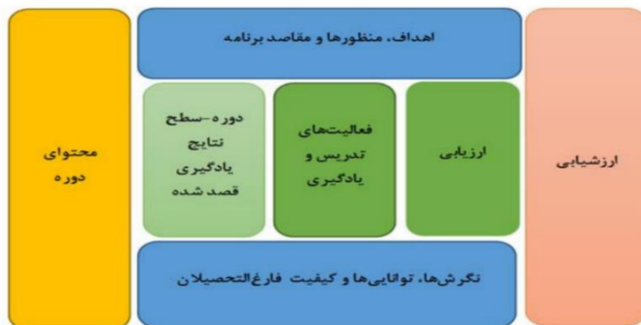
شکل شماره ۴- الگوی برنامه ریزی درسی ونز(۲۰۱۷)

الگوی ۵ برنامه ریزی درسی فرآیندی (اقتباس از بردی، ۲۰۱۳)