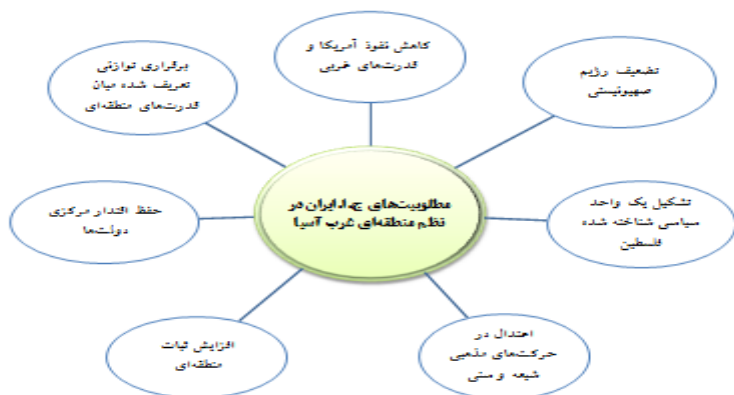
شکل شماره (۲): مطلوبیت‌های ج.ا.ایران در نظم منطقه‌ای غرب آسیا (قاسمی، ۱۳۹۶)

(۷) برقراری توازن تعریف شده میان قدرت‌های منطقه‌ای: ج.ا.ایران تلاش دارد توازن در منافع و قدرت میان بازیگران اثرگذار در منطقه شکل دهد و هیچ‌گاه سیاست حذف رقیب را در پیش نمی‌گیرد. این موضوع در مورد ترکیه و عربستان سعودی به عنوان دو رقیب منطقه‌ای صدق می‌کند. البته ج.ا.ایران دست‌یابی به این توازن را از طریق الگوهای همکاری جویانه میسر می‌داند نه الگوهای تعارض. (قاسمی، ۱۷-۱۳۹۶: ۲۰)