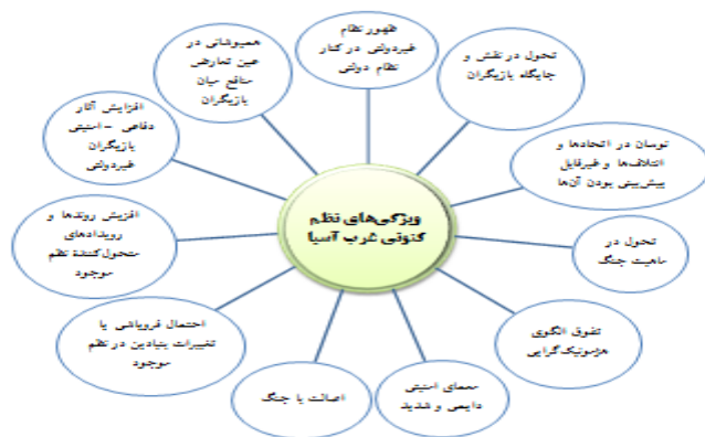
شکل شماره (۱): ویژگی‌های نظم فعلی غرب آسیا (نقدی، ۱۳۹۷)

(۱۱) معمای امنیتی دائمی و شدید: به دلیل اصل بودن منازعه و جنگ در منطقه، رفتار بازیگران (ولو به صورت تدافعی) از سوی رقبای تهاجمی تلقی شده و آن‌ها را به عمل متقابل و افزایش توان دفاعی و نظامی سوق می‌دهد که نتیجه آن تداوم رقابت تسلیحاتی و وضعیت معمای امنیتی شدید در منطقه است. (نقدی، ۱۳۹۷)