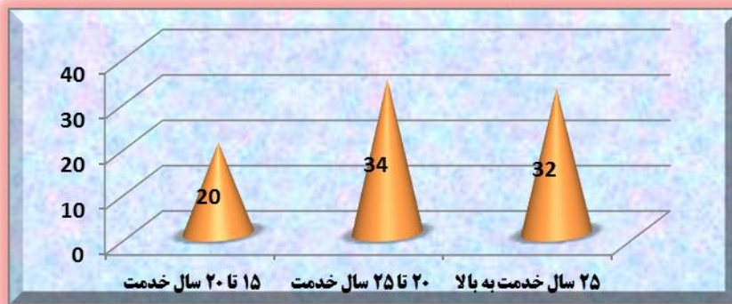
نمودار شماره ۱: سنوات خدمت جامعه نمونه

متغیرهای جمعیت‌شناختی تحقیق عبارت‌اند از سنوات خدمت، میزان تحصیلات، رشته تحصیلی، میزان آشنایی با فرهنگ مهدویت، میزان آشنایی با قدرت نظامی. با توجه به اینکه امکان تحلیل ویژگی‌های بالا در یک مقاله وجود ندارد لذا فقط ۲ ویژگی، سنوات خدمتی و میزان تحصیلات تجزیه و تحلیل می‌گردد. همانگونه که در نمودار شماره (۱) مشخص است تعداد ۲۰ نفر از جامعه نمونه بین ۱۵ تا ۲۰ سال و ۳۴ نفر بین ۲۰ تا ۲۵ سال و ۳۲ نفر دارای ۲۵ سال خدمت به بالا می‌باشند. این امر بیانگر باسوادی جامعه نمونه می‌باشد.