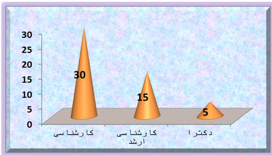
نمودار شماره ۱: مدرک تحصیلی جامعه نمونه