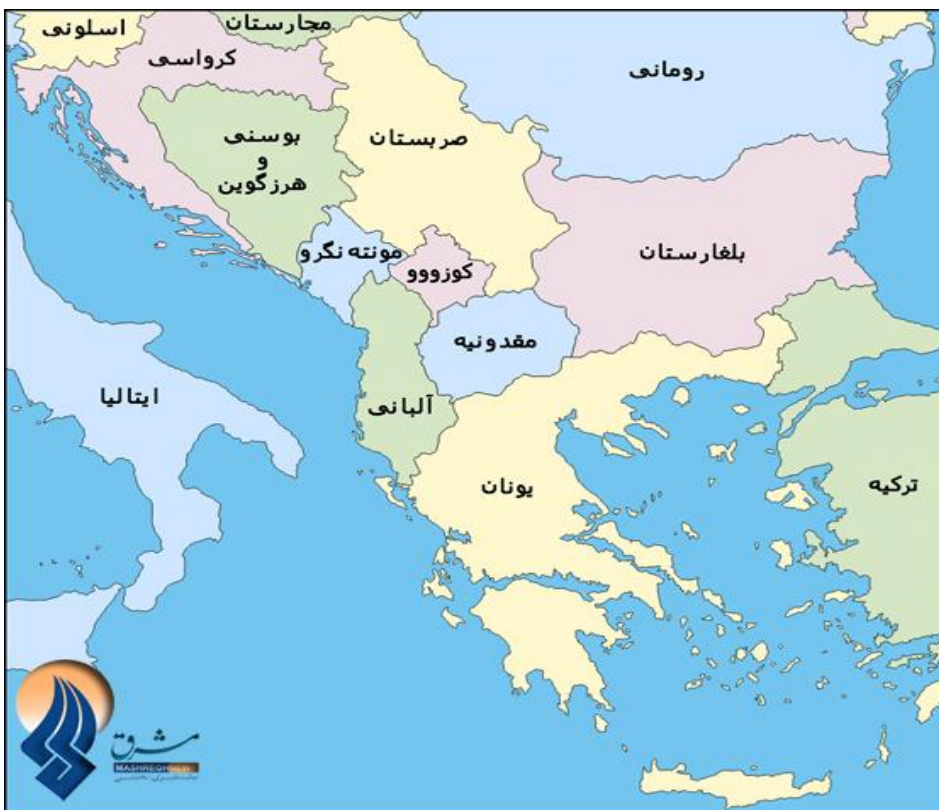
نقشه شماره ۱: کشورهای شبه‌جزیره بالکان