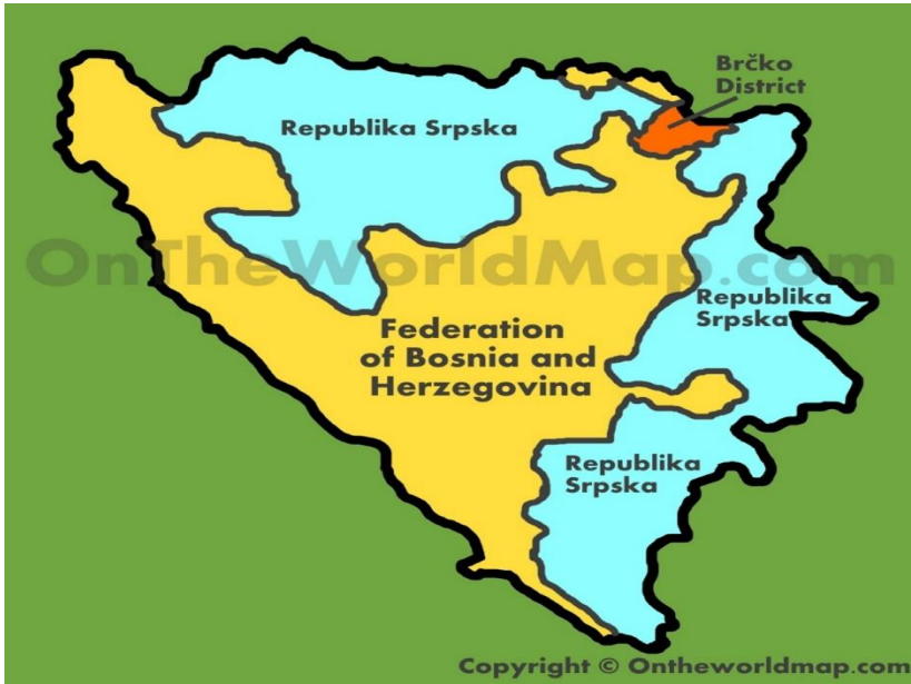
نقشه شماره ۳ (جمهوری صربسکا، فدراسیون مسلمان - کروات و منطقه برچکو)