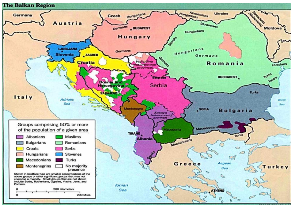
نقشه شماره ۲: توزیع پراکندگی جمعیت اقوام در بالکان

جزو چالش‌های اصلی سرزمین بالکان به‌ویژه یوگسلاوی سابق محسوب می‌شوند (عسگری، ۱۳۹۵، ۱۰۶).